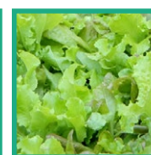
Lattughino da Taglio

SEMINA: angurie, asparagi, basilico, bietole, carciofi, carote, cavoli, cicorie, cipolle, indivia, fagioli, fagiolini, finocchi, lattuga, meloni, melanzane, peperoni, piselli, prezzemolo, ravanelli, rucola, sedano, spinaci, valeriana, zucche, zucchine.