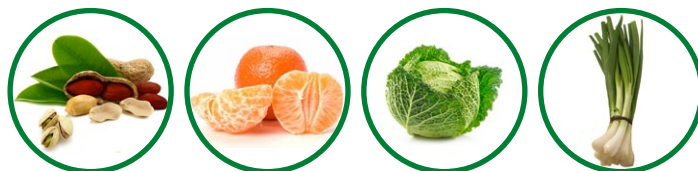
Frutta secca Mandarini Cavolo Verza Porri

FRUTTA: arance, cachi, castagne, frutta secca, kiwi, limoni, mele, mandaranci, mandarini, pompelmi.