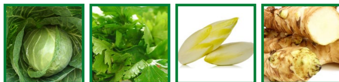
Cavolo Cappuccio Sedano Indivia Topinambur

SEMINA: aglio bianco, cavolo cappuccio, crescione, fave, lattughe da taglio, melanzane, meloni, piselli, pomodori, peperoni, ravanelli, sedano.