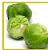
Cavoletti di Bruxelles