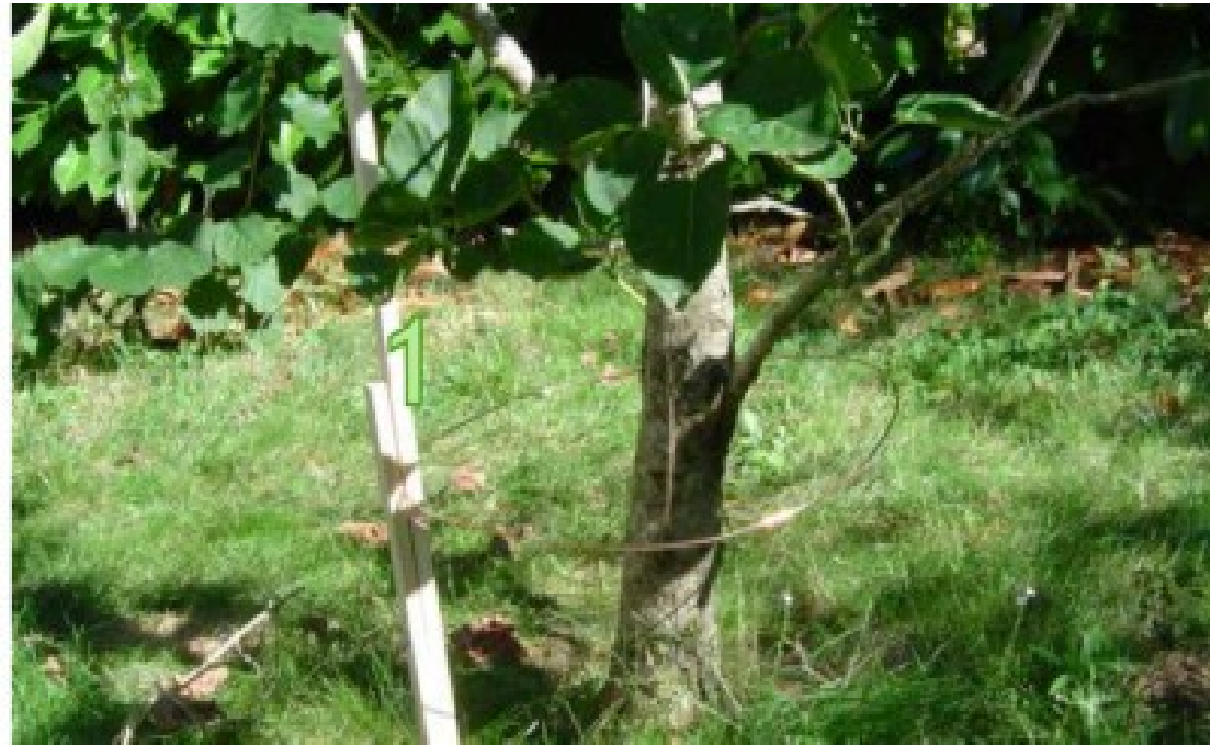
Lakhovsky Coil / Antenne Lakhovsky :