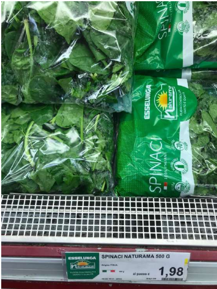
Spinaci in busta non bio 3,96€ al kg↑