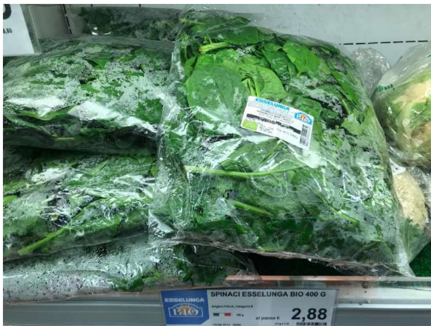
Spinaci in busta "biologici" 5,76€ al kg↑ contro i 3,60€ al kg dei nostri