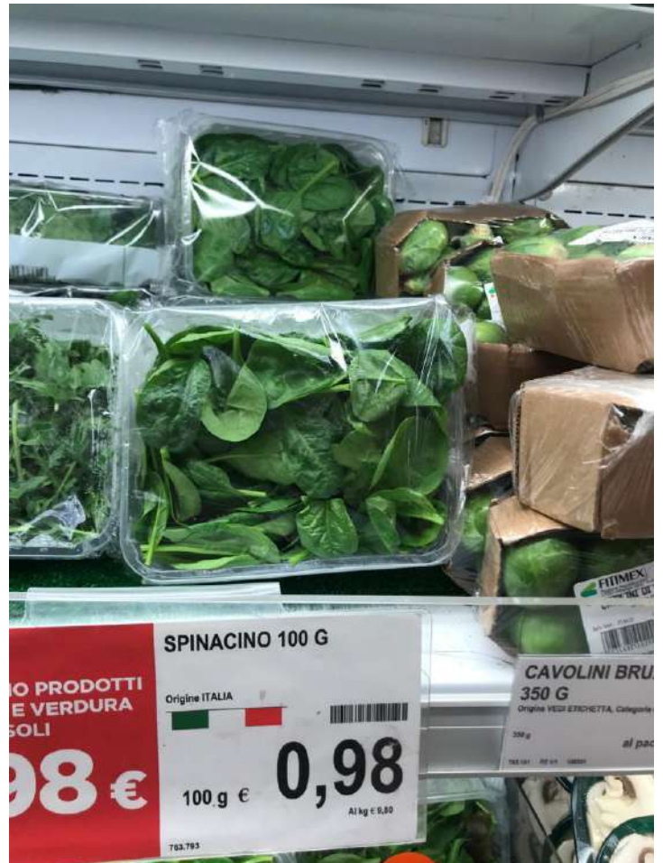
Spinacino non bio 9,80€ al kg↑