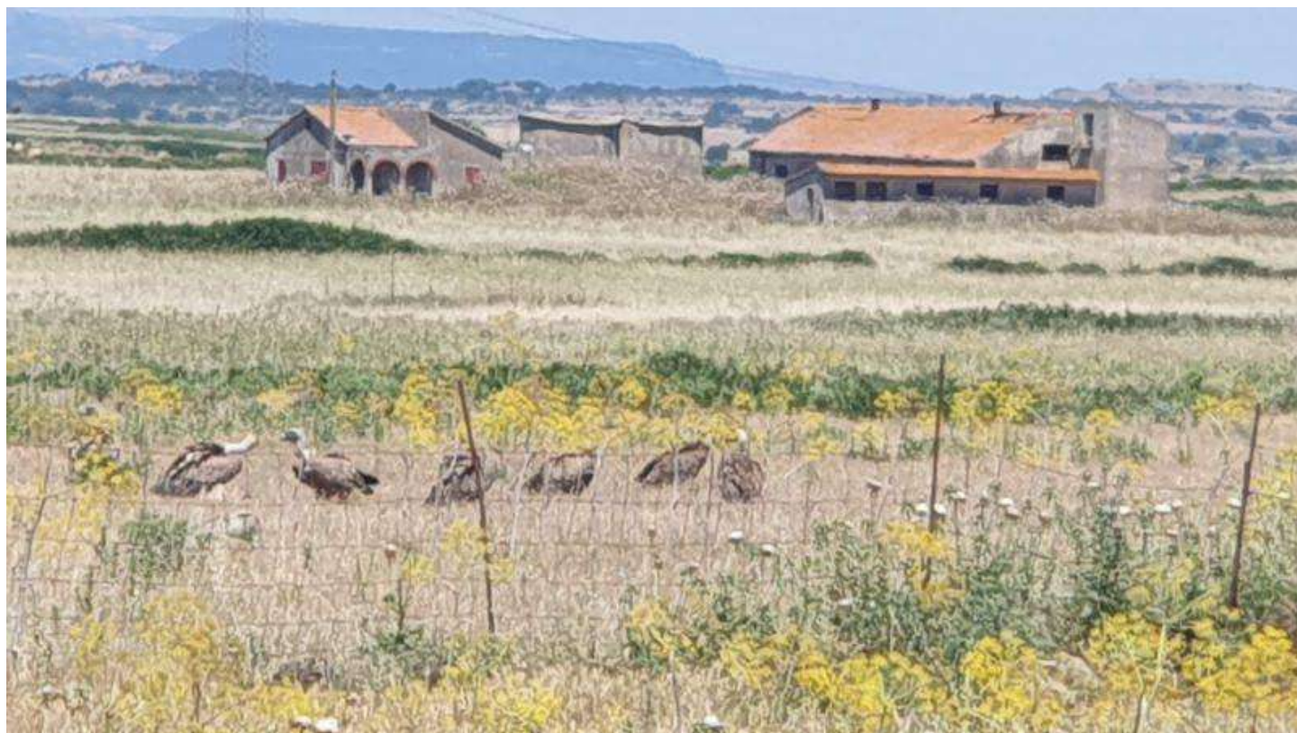
Foto di grifoni sardi in azienda per alimentarsi.