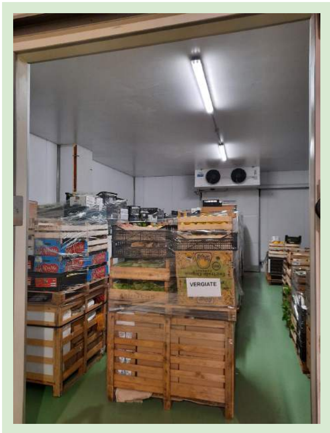
il primo ritiro