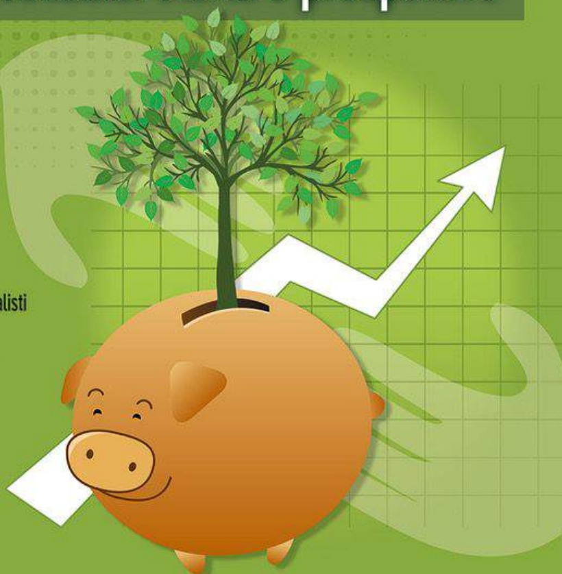
Tavola rotonda con rappresentanti dell'Economia Solidale, DES e RES

Iscrizione obbligatoria a questo link: www.aequos.eu/index.php/eventi/cultura-aequos