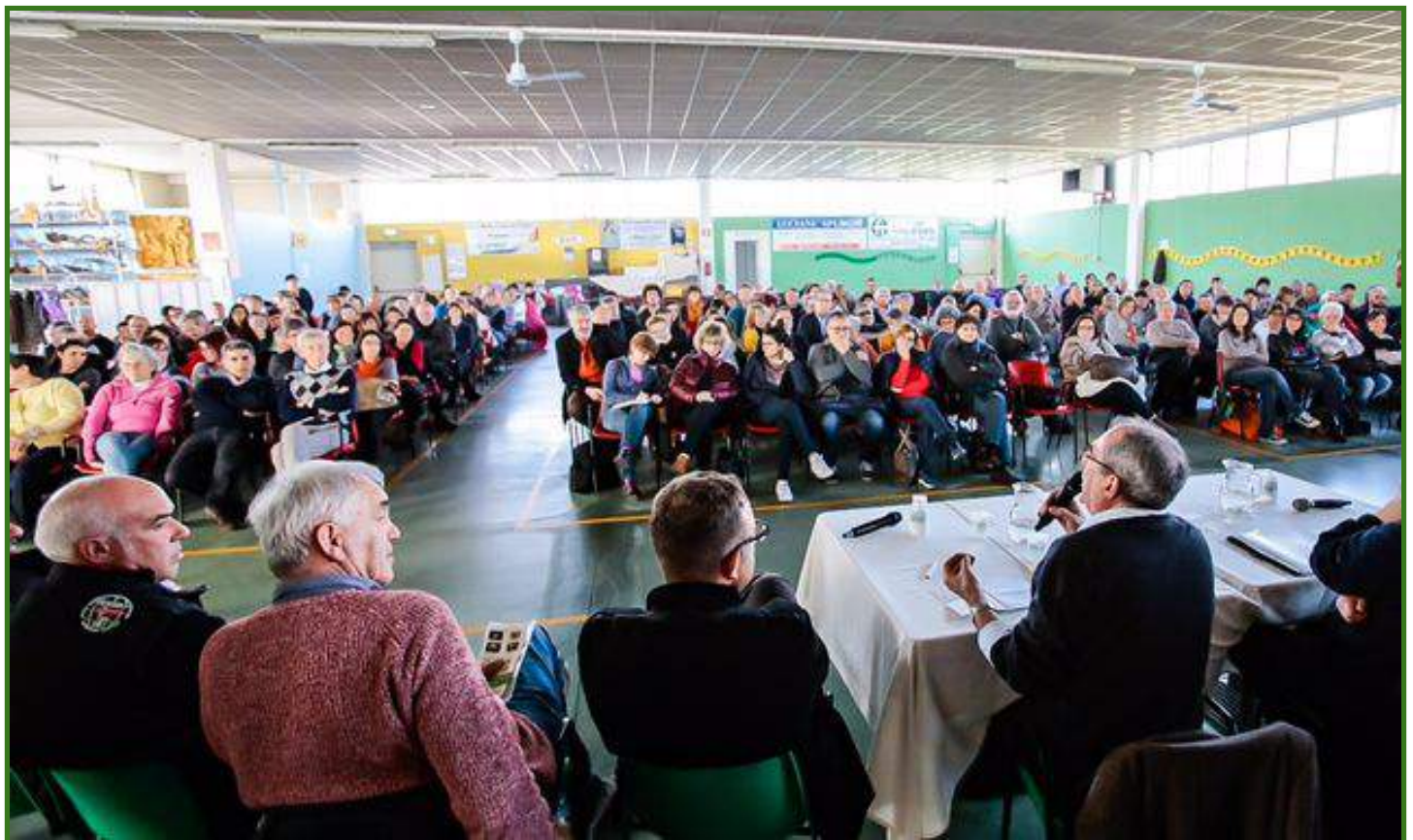
i produttori, i gasisti di oggi...